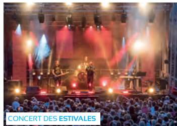
CONCERT DES ESTIVALES