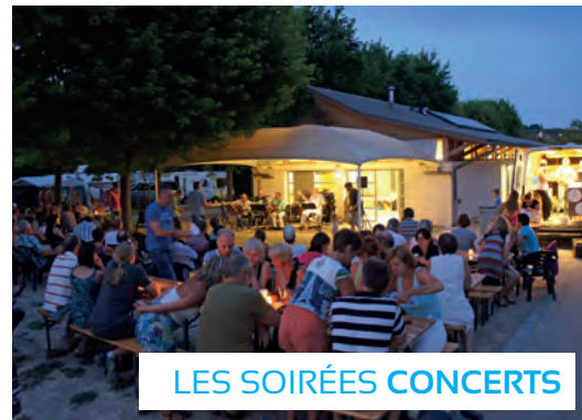
LES SOIRÉES CONCERTS