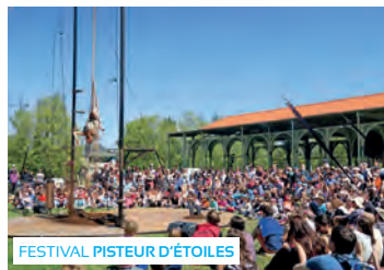
FESTIVAL PISTEUR D'ÉTOILES