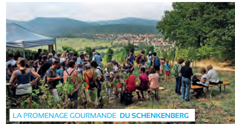
LA PROMENAGE GOURMANDE DU SCHENKENBERG