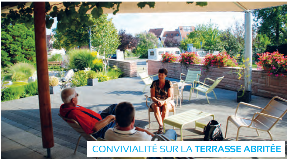
CONVIVIALITÉ SUR LA TERRASSE ABRITÉE