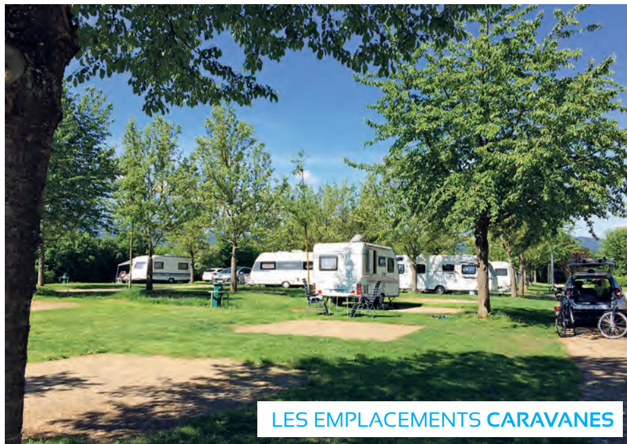
LES EMPLACEMENTS CARAVANES