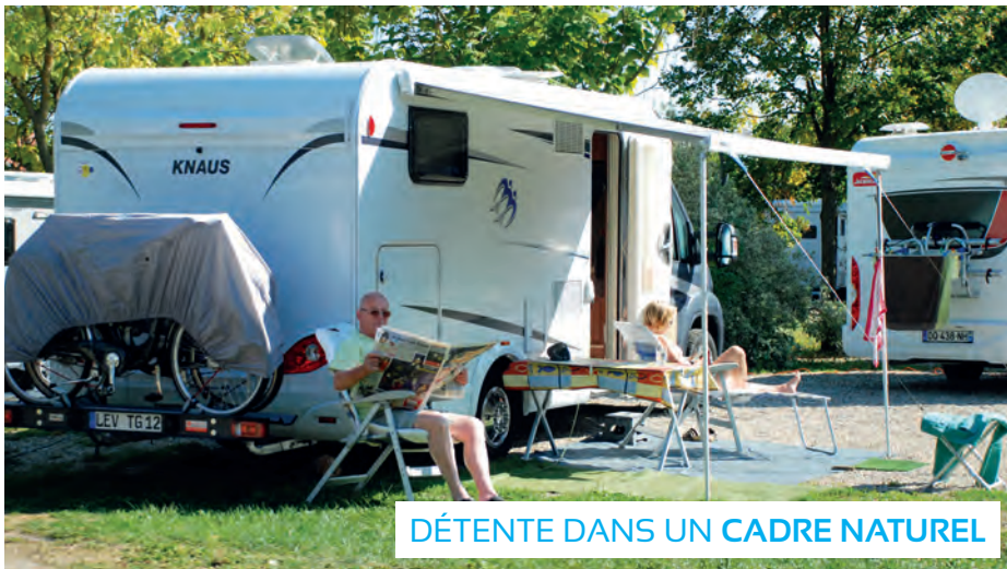
DÉTENTE DANS UN CADRE NATUREL