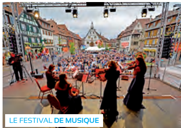
LE FESTIVAL DE MUSIQUE