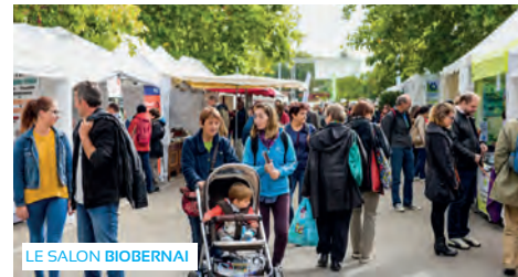
LE SALON BIOBERNAI