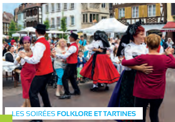
LES SOIRÉES FOLKLORE ET TARTINES